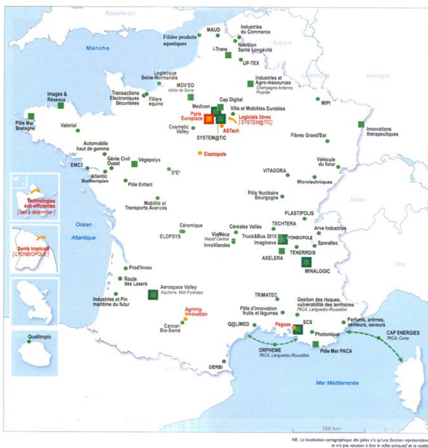
Carte 1 : Les 71 pôles de compétitivité

NS : La localisation cartographique des pôles n'a qu'une fonction représentative et n'a pas vocation à être le reflet exhaustif de la réalité.