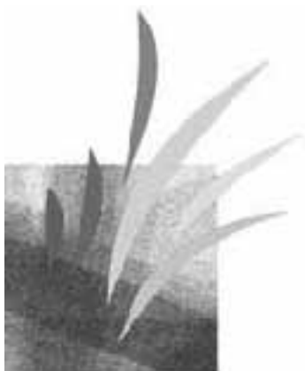
LOGO DU SAUE de la DDE de l'oise