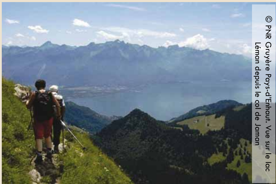
Vue sur le lac Léman depuis le col de Jaman

De même dans une situation totalement différente comme en Suisse où domine l'économie pastorale liée à la "civilisation du Gruyère" (ainsi que les acteurs locaux la nomment), le paysage est, là aussi, fortement relié à des questions de patrimoine quand il est évoqué explicitement dans le projet de parc naturel régional, avec par exemple la réimplantation locale de verger haute tige ou l'entretien des murets et terrasses... A ces actions symboliques ou patrimoniales, s'ajoute celle intéressant les "grands paysages", pour lesquels l'aménagement de chemins comme "Le Grand Tour", veut offrir à la vue des touristes, les grands panoramas, au sein desquels les paysages de la civilisation du gruyère, issus de l'économie agricole "traditionnelle" sont avancés comme les symboles d'une harmonie entre l'homme et la nature. La profession agricole agrée cette manière d'approcher les choses parce qu'elle y voit la reconnaissance