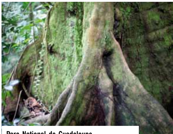
Parc National de Guadeloupe.

Sans jamais chercher à minimiser les problèmes identifiés et à masquer les sensibilités parfois différentes pour les traiter, les rapports du GNFT dessinent progressivement les contours d'une vision partagée des acteurs français agissant dans le domaine de la protection et du développement. Ils proposent des orientations politiques et stratégiques aux acteurs français et contribuent en particulier à