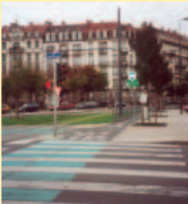
Piste aménagée en traversée d'agglomération le long du tramway avec passage sur voirie sécurisée à côté des piétons