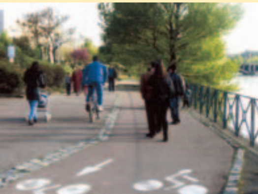
Bas-ports à Lyon (véloroute Léman-Méditerranée)

Dans un souci de cohérence avec les réalisations cyclables «de ville» et les autres modes de transport, les entrées-sorties d'agglomération et les traversées des véloroutes-voies vertes sont à traiter dans le cadre des schémas vélo et des plans de déplacements urbains