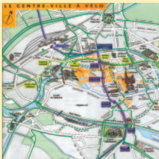
Relier les itinéraires cyclables urbains aux véloroutes-voies vertes vers l'extérieur de l'agglomération fait partie d'une démarche globale déplacements de type PDU et SRU