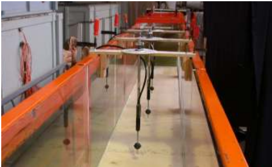
Figure 1 : vue en long du canal à houle utilisé dans le cadre du programme

Concernant les aspects de modélisation, un canal à houle (figure 1) a été mis à disposition de l'étude par le centre de Morphodynamique Continentale et Côtière de l'Université de Caen. Il s'agit d'un réservoir d'une longueur utile de 15 mètres, d'une hauteur de 0,65 mètre et d'une largeur de 0,50 m permettant, par l'intermédiaire d'un batteur, de recréer des houles aux caractéristiques connues (hauteur, période).