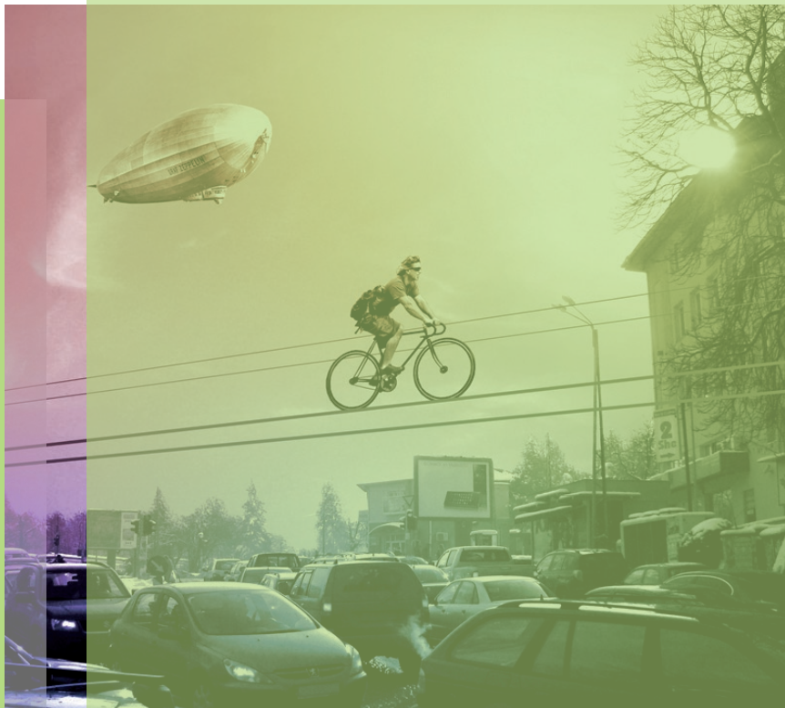
| Kolelinia, concept de pistes cyclables alternatives, Martin Angelov, 2009. Creative Commons